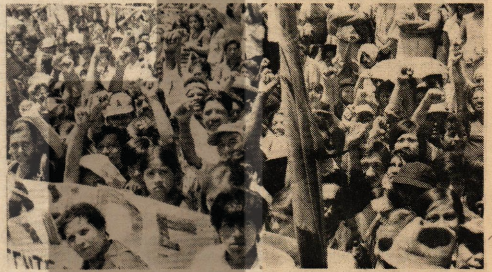
Nikaragua'da Ulusal Kongre binasının önündeki Başkent Devrim Meydanında düzenlenen 150.000 kişilik mitingten iki görüntü